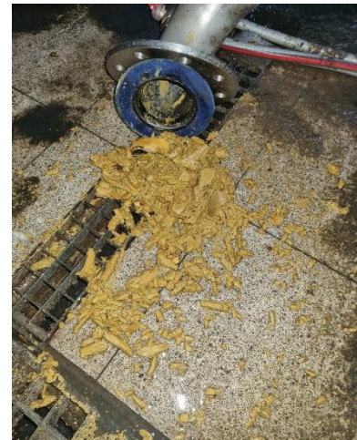
Verstopfte Pumpe

Die entstehenden Fettklumpen, vermischt mit nicht ordnungsgemäß entsorgten Essensresten sowie Papier, bilden Säuren, die für Korrosion am Rohr verantwortlich sind. Sie schädigen langfristig das Rohrmaterial. Die Folgeeffekte: Hohe Beseitigungskosten und eine stark verkürzte Lebensdauer der Abwasserrohre. Die Beseitigung der Fette ist für unsere Mitarbeiter der Kläranlage mühsam, denn aggressive Reinigungsprodukte können aufgrund deren Auswirkung auf die nachfolgende Abwasserreinigung in der Kläranlage nicht eingesetzt werden. Zudem wird viel Frischwasser für die Reinigung benötigt.